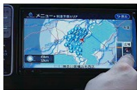
▲走行可能エリアと充電スポットがわかる

ませんでした。が、「衝撃的な加速」と「心地よい加重バランス」これが乗った後のリーフのイメージ。エンジン音が全くないため、スタート時にはドライバーに始動を知らせる音が流れます。1回の充電で（家庭では8時間でフル充電となる）市街地では約160km走行可能。家庭のエアコンにも使われている200Vの電源にのみで充電でき、深夜なら1回の電気料金は100円以下とのこと。 中央のフラットパネルでは電池残量に応じた走行可能エリアが表示されるので、どこまで走れるかがわかります。本体価格は376万円。ちょっと値が張りますが、県や市の補助金制度もあるので、これからどれくらい身近なクルマになるのか楽しみです。