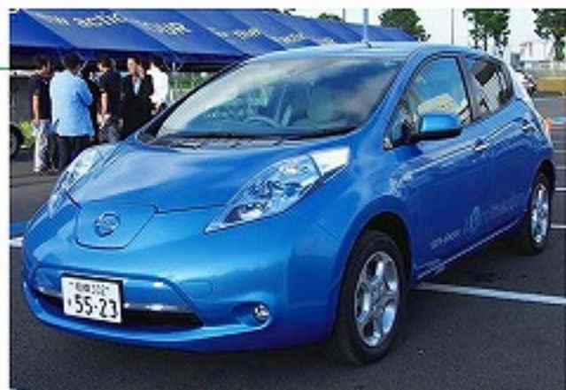
▲これがリーフです

電気を使用しているので走行中の排気ガスがゼロ。CO 2 の排出量はガソリン車の3分の1程度。現在走行している自動車の中で最も環境性能に優れているといわれ、これからの地球環境のために注目が集まっている電気自動車。街中で最近充電スタンドとともに少しずつ目にするようになりました。「いつかは運転してみたいなあ」と思っていたところ、日産自動車が今年12月発売を予定している電気自動車（EV車）の試乗会に参加できることになりました。 電気自動車は初めてなので、どんな感じがするのか全く想像でき