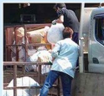
満ばいの荷物を降ろす

ほっとけない！その1 ある学校では紙コップに至るまできちんと分別していたのに当時の回収業者が、分別を無視してすべてを一緒にパッカー車にごみとして積み込んでいた、その話を聞いて「とんでもない！」と気にしていたが最近業者が変わったと聞いて一安心。