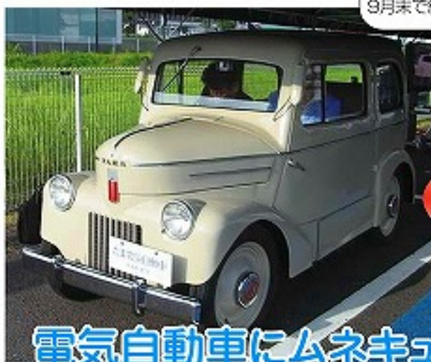
エコカー補助金制度の9月末で終了は悲しいです

あなたが「もったいない」と感じることを120文字以内でお寄せください。宛先はINFORMATIONのページに。