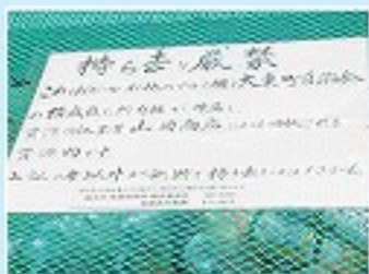
大東町町内会館に設置されたアルミ缶回収場所の張り紙