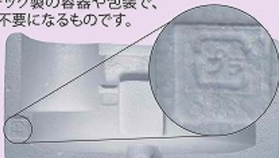
発泡スチロールの緩衝材にはこんな表示があります。

プラスチック製容器包装とはプラスチック製の容器や包装で、商品を消費したり商品と分離した場合に不要になるものです。