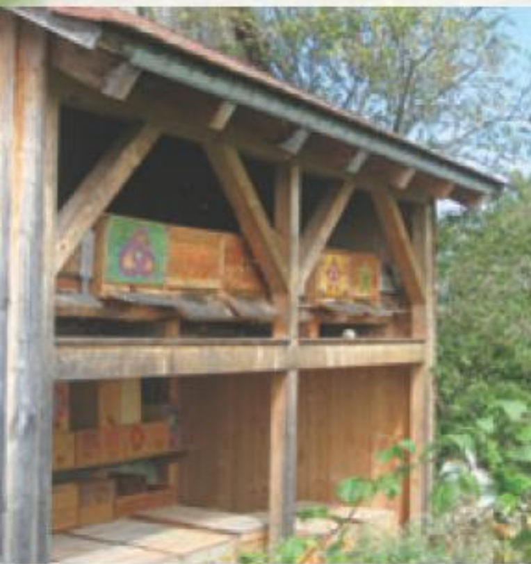
巣箱とミツバチたち

スイス国境近くの「アンドレアス農園」。見渡す限りの緑と整えられたガーデンの調和が美しいこの農園の特産品は、なんと山芋。ただし日本食のように生で食べるのではなく、乾燥粉末にしてクッキーや化粧品に加えています。他にも数々の農作物を栽培しています。 ここにたくさんのミツバチがいますが、巣箱にはカラフルな模様がペイントされて、落ち着いた農園の雰囲気とはちよつと違う感じ。実はこれ、近隣のシュタイナー学校「ボーデン湖自由ヴァルドルフ学校」の生徒たちがお世話しているのです。 シュタイナー人智学は、その独特の世界観がしばしば普通の学校教育と齟齬