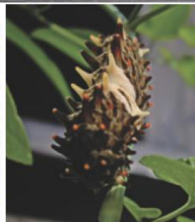
◀ 食草のウマノスズクサと幼虫

変態をくりかえしましたが、寒くなると活動しなくなります。秋の終わり頃、幼虫は高めの場所に這っていき、サナギになって壁にくっつき半年間もそのままです。お気に入りの場所をさがして10ヶ月くらい遠くへ行く時もあります。春になり充分暖かくなるとオスが先に羽化し、雌の羽化を待ちます。ジャコウアゲハのサナギはまるでお面のようなです。見つけてもさわらないでね。 ササキミチコ