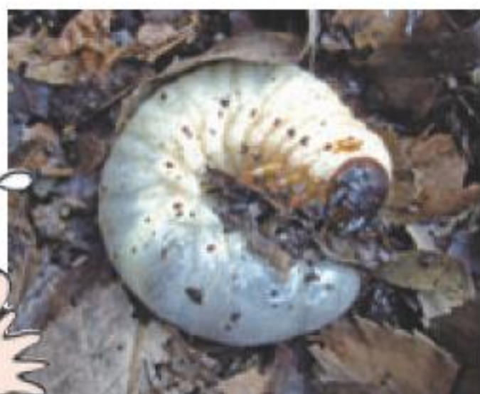
▲ 落ち葉堆肥のなかで越冬するカブトムシの幼虫

カブトムシの幼虫は、ほの暖かい落ち葉堆肥の中で丸々ふとります。成虫のまま樹皮の中に入り込み、寒さに耐える昆虫もいます。