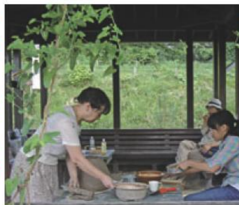
◀ ウマノスズクサの緑のカーテン

ジャコウアゲハは、夏の間じゅう食草のウマノスズクサに卵を産み付けます。ジャコウアゲハは草の匂い成分のフェロモンにつられてやって来るのです。ウマノスズクサには、アルカロイドという毒があるのですが、卵からかえった幼虫ははむはむ食べて日に日に大きくなります。幼虫は毒を分解できる消化酵素を持つようですが、体内に毒が残るので鳥に食べられずにすむそうです。そのせいか幼虫は、ロールケーキみたいなクリーム色の模様つきで目立ちます。