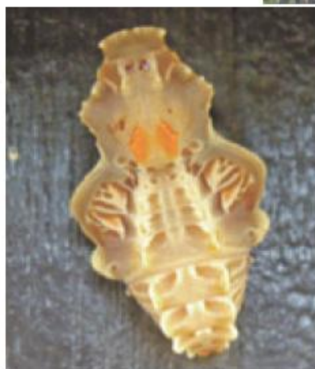
◀ ジャコウアゲハのさなぎはお面みたい