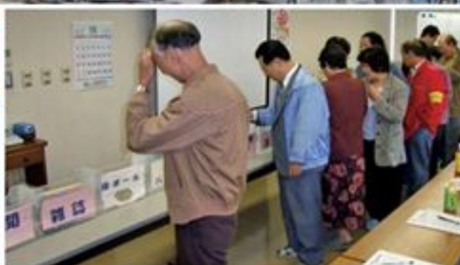
▲リサイクルの基礎講座1-資源とごみの分別体験 皆さんが行っている分別にはどんな意味があるのでしょうか?

▲古紙・古布の輸出施設の見学 集められた古紙がどのようにして資源製品になっていくのでしょうか?