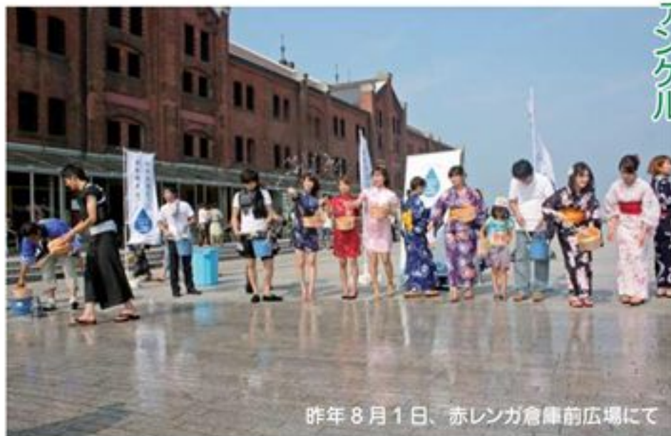
昨年8月1日、赤レンガ倉庫前広場にて

「参加した初年度が最も効果が出やすく、年数を重ねると成果を出しにくくなってきます。元々褒賞金を出すことが目的ではないので、従業員に省エネ生活が定着したら徐々になくしていくべき性格のものだと考えます。ひとりの市民、家庭人としては家庭で省エネに精を出す一方、CSR(企業の社会的責任)の面では横浜市の水道局その他と連携してYOKOHAMA save the water という水プロジェクトに取り組んでいます。横浜打ち水大作戦、水教育、市民参加型イベントを今年も開催予定です。詳しくはホームページ( http://y-savethewater.jp/index.html )を「検索」