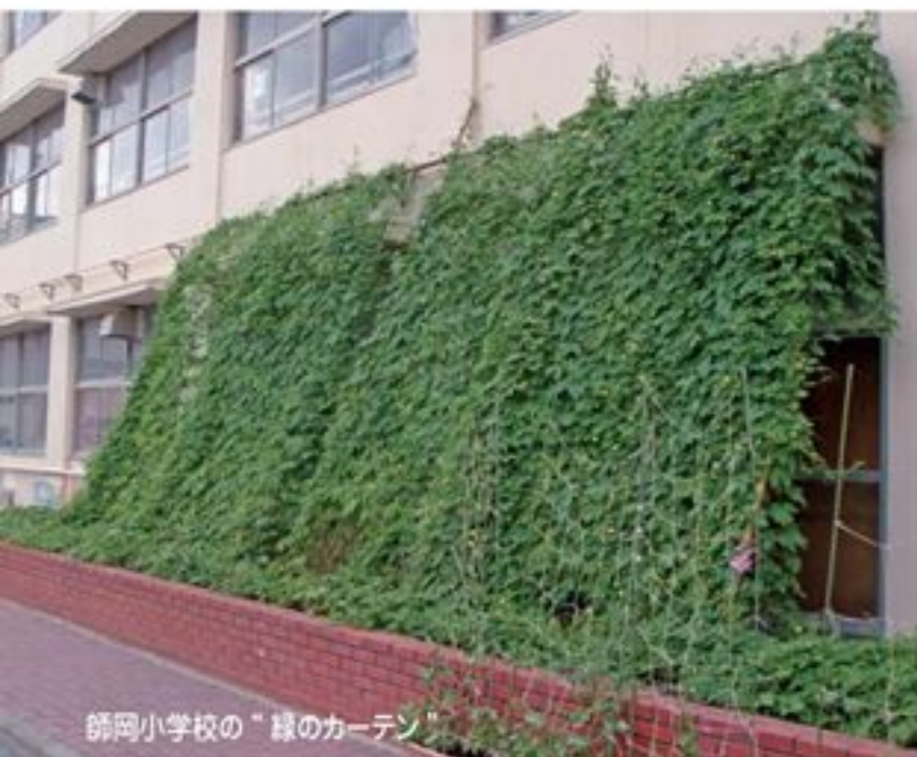
師岡小学校の「緑のカーテン」