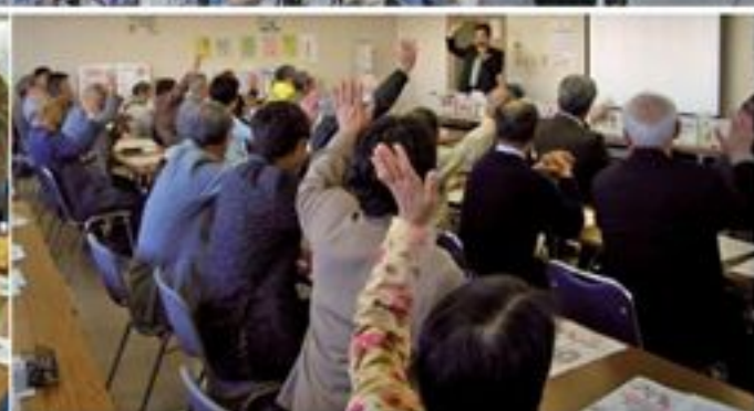
▲リサイクルの基礎講座2-資源循環の国際化 古紙・古布の輸出の始まりと横浜ブランドができるまでのお話