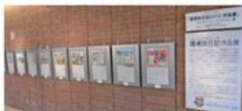
昨秋の JICA 横浜ギャラリーでの展示の様子

環境絵日記の中から水道局が選んだ「水と緑」をテーマに描かれた作品の展示を上大岡京急百貨店にて開催します。 月刊リサイクルデザイン誌上では特別賞の作品のみの紹介ですが、今回は直接環境絵日記をご覧ください。ぜひ会場でも子どもたちの描いた環境絵日記をご覧ください。