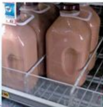
リユースするミルク容器。

リユースするミルク容器があります。スーパーでミルクを買うと、ビン代として確か1ドル50セント取られるけれど、飲み終わってびんを戻すと返金してくれます。そのミルクは近所の牧場からの絞り立てなのでおいしいです。これ以外ではリユースする容器は出回っていません。