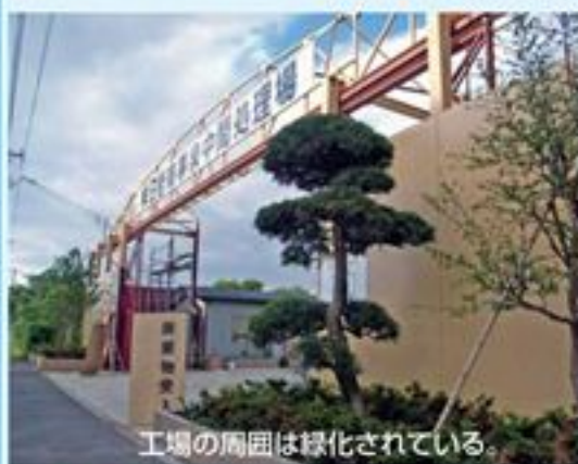
工場の周囲は緑化されている。

学校の仲間とは、英語はうまくなくてもバイクの専門知識があれば通じ合うことができた。その一方ガールフレンドはさっぱり。アメリカでの日本男子のイメージは「積極的でない」「亭主関白」と全然もてなかったが、好きな事だけに没頭した日々は何にも代え難い経験だった。憧れのハーレーとホンダの整備士免許を取得して帰国した。