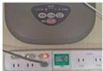
扇風機「強」で使用すると 40W