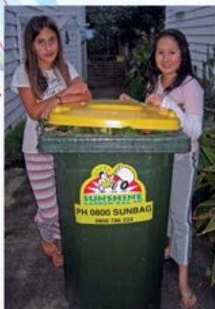
▶ ガーデンラビッシュのウィーリービン

自宅の庭の枯れ葉、雑草、芝刈りで出た芝や、樹木などを切った際に出る小枝や葉など、もろもろの植物。これは、各家庭が一般業者と契約（有料）し、回収に来てもらいます。回収ひん度は契約により、うちは月に1回。秋から冬は庭の大きな枯葉がごっそり出るので、月に1回の回収では追いつかないくらい。お金を払ってまでガーデンラビッシュを回収してもらいたくない人達は、一般ごみ（赤い蓋のウィーリービン）に入れて捨てているみたい。違反切符はなく、回収車は持っていったらいいです。