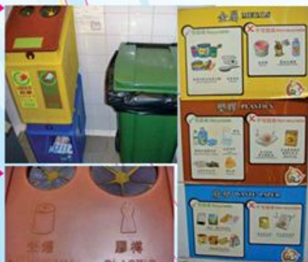
イラスト付きポスター

これがごみ捨て場の「ごみ箱」。分け方はイラスト付きのポスターで表示してあります。