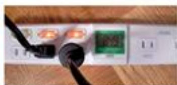
掃除機とノートパソコンの同時仕様で 849W