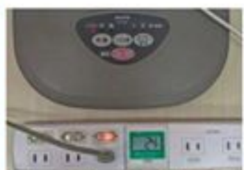
扇風機「弱」で使用すると 24W

3月の震災以降、家でも事務所でもできる限りの節電をしていますが、これから真夏に向けて更なる節電をしようと思ひ、節電グッズや涼しくなるアイテムを日々探していました。本誌201号の特集「オール電化」の取材をした際に、ワットチェッカー（消費電力や電圧、電流などを測定してくれる装置）を使ってみたところ気に入ったのでネットで探していたら、ワットメーター付きの電源タップを発見！これはお得ではないか？と思っただけでいろいろチェック。個別スイッチが3個あり、こまめにオン・オフして待機電力を減らせます。真ん中にワットメーターの表示があり、その隣にはACアダプタに使える幅の広い差し込みが2つ。携帯電話や充電機の充電と一緒に使うと隣同士キツキツになって使いにくいことたびたびでしたが、それも解消。消費電力量が合計で1500Wを超えると警告のブザー音が鳴り、そのままの状態を少しすると内蔵されたブレーカーが落ち自動的に切れ、リセットボタンを押せば元通り使えます。ブザーが鳴っても、必要度の低い物のスイッチをすぐにオフにすればそのまま使えます。早速購入。ノートパソコンと掃除機を同時に使ったら、850W近くまで一気に上がりました。数字を気にしながら掃除機をかけていると、効率よく早く終わらせようという気持ちになります。普段は消費電力量なんて気にしないというか、分からないので何気なく使っていました。他にも色々な電化製品の消費電力を調べて、電気のコトを使いをなくすことに。もう1個買おうかな……。