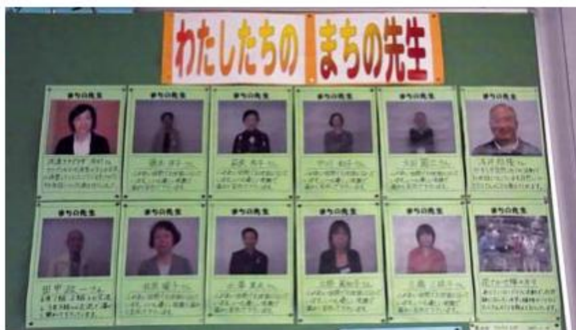
まちな先生がおおせい協力してくれます。

「夏休み明けに自分が描いた環境絵日記を発表する会を各クラスで開き、自分の作品を友だちや先生からほめられたり、助言されたりする機会をもっています。それで、来年もがんばろうという気持ち生まれるのだと思います。家庭でも親子で環境やリサイクルについて日常的に話すチャンスが多いようで、学校賞の受賞は、子どもたちだけでなく保護者のみなさんにもたいへん喜ばれています」