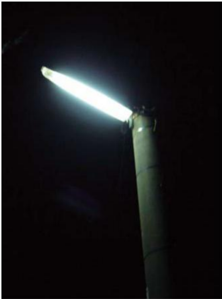
蛍光灯タイプの防犯灯。