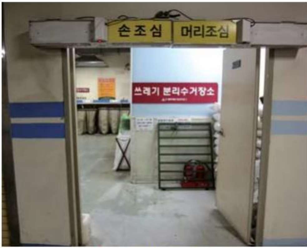
▲ 共同住宅のごみ置き場。

韓国では空きびんをスーパーなどに持っていくと30ウォン(約2円)から50ウォン(約3・5円)もらえます。空きびんなら何でも大丈夫です。詳しくはわかりませんが、びんの大きさや重さによってももらえる金額は少しずつ違います。また、新聞、雑誌、紙箱などの紙類は1キロあたり50ウォンくらい、鉄類は70ウォン(約5円)くらいもらえますので、それだけを回収するリサイクル業者もいます。