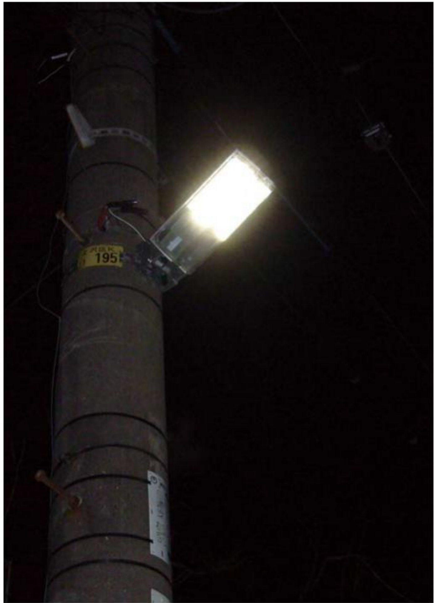
これがLEDの防犯灯、蛍光灯タイプよりコンパクトである。しかも明るい。

最近、街の防犯灯がやたら明るいと思った。よく見てみると何か形が今までとは違うことに気がつく。