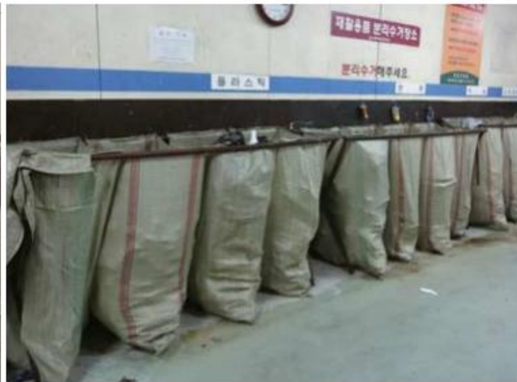
▲ 手前から奥に向かってプラスチック・缶類、ビニール入れです。

プラスチックはプラスチックの原料や、アンモニアなどの化学原料、製鉄所で利用するコークスなどに利用されています。