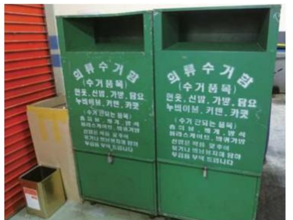
▲ 古着などはここに入れます。白い文字で「衣類回収箱(回収品目)古衣類、靴、バッグ、毛布、布団、カーテン、カーペット」と書かれています。