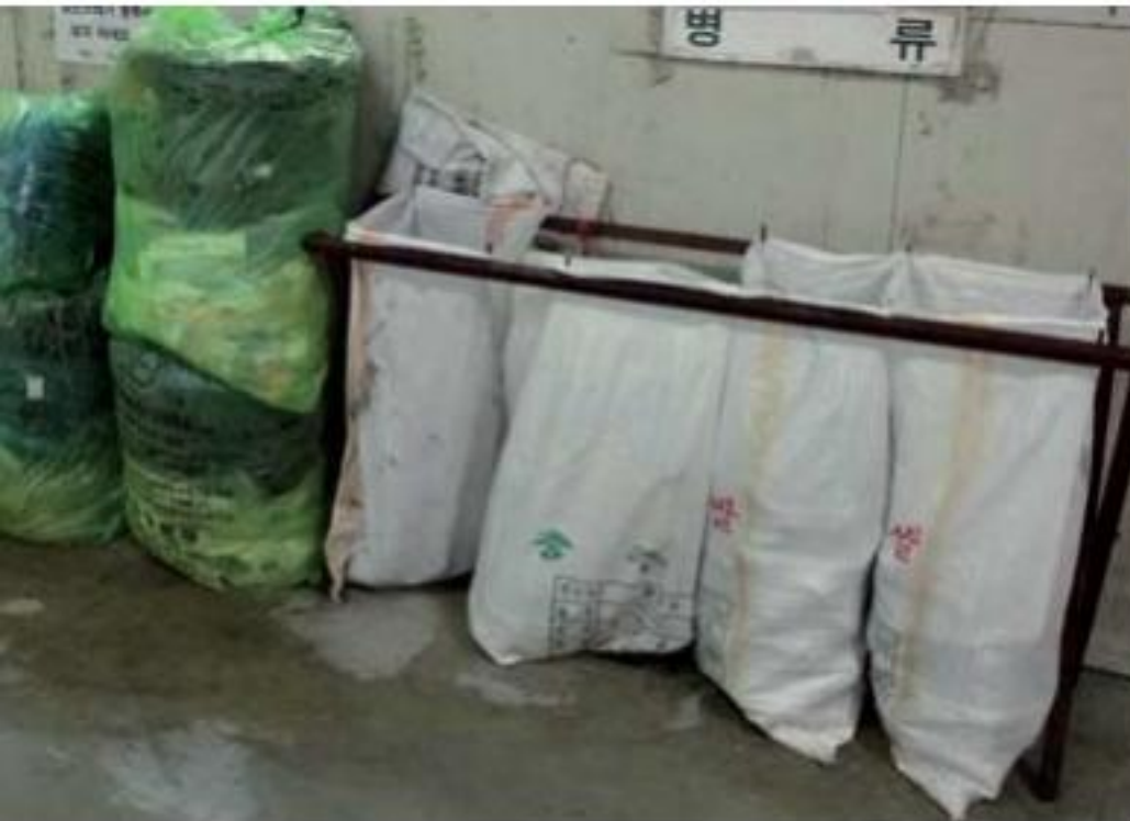
▲ びん類は白い入れ物に入れます。