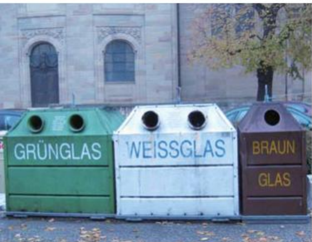
▲びん類を色別に入れる大型コンテナ。

私の住む街ではワインびんや野菜や果物のびん詰めびん、デポジットのないビール缶などはルントミュル(丸型ごみ)に入れてしまいますが、