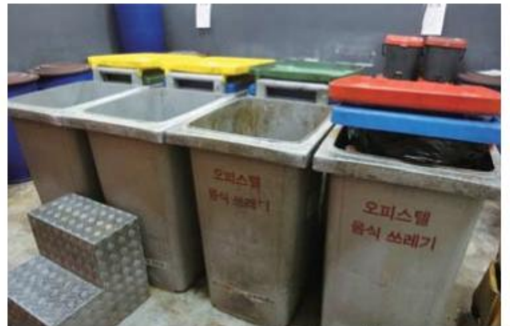
▲ 生ごみ入れのボックス。

きれいにし、金属の部分だけ出します。スプレー缶は、プラスチックのふたを外して安全なところに穴を開けて出します。