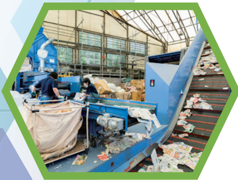
古紙のリサイクル現場 (株式会社富士紙業)