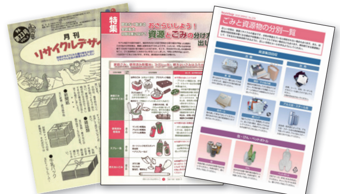
ごみと資源物の分別紹介記事