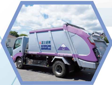
古紙の回収車両 (株式会社富士紙業)

今号で『リサイクルデザイン』はひとつの区切りを迎え、広報としての役割を終えることとなります。しかし、横浜の資源循環はこれからも止まることなく続いていきます。わたしたちの活動も終わることなく、よりよい街づくりをめざして今後も歩みを進めていきます。