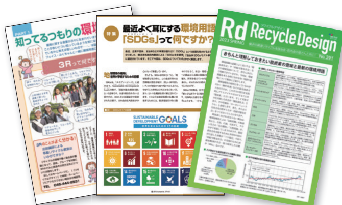
環境用語解説の記事