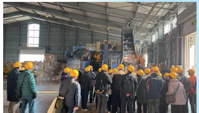
町内会の皆さんによる山ノ内見学会(2024年)