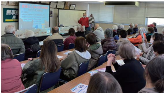
町内会の皆さんとの分別講座(2024年)