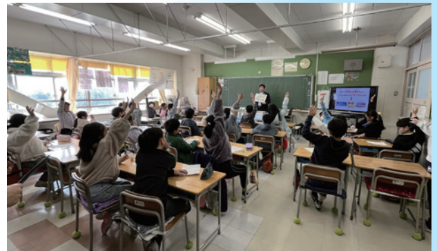
横浜市立上大岡小学校での出前講師(2026年)