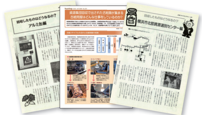
リサイクルの現場レポート記事