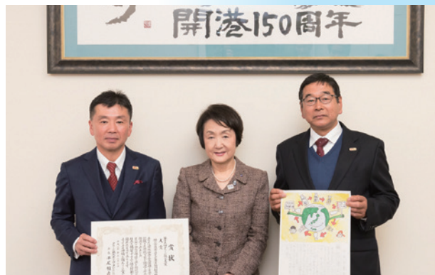
リサイクル組合が第19回グリーン購入大賞を受賞。林文字横浜市長と記念撮影(2018年)