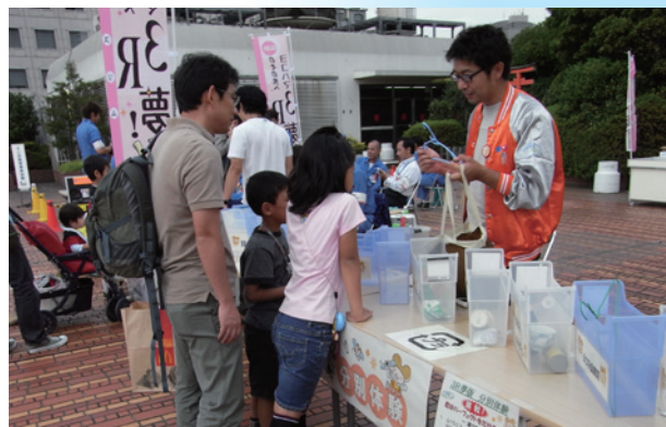
3R推進キャンペーンのリサイクル組合のブース(2011年)