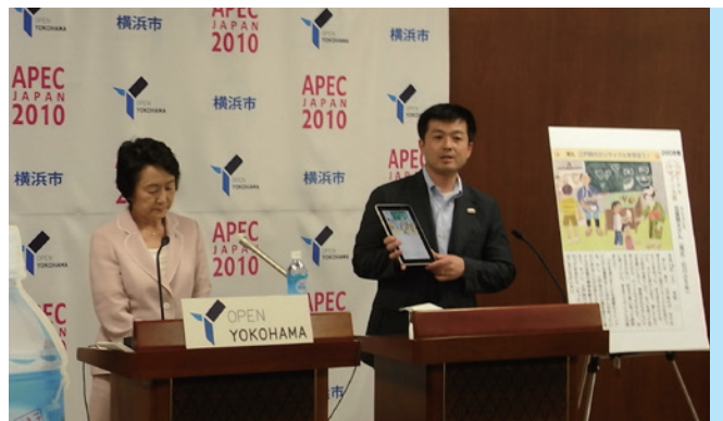
日本APEC横浜でリサイクル組合がカーボンオフセットに協力。林文字市長と記者会見(2010年)