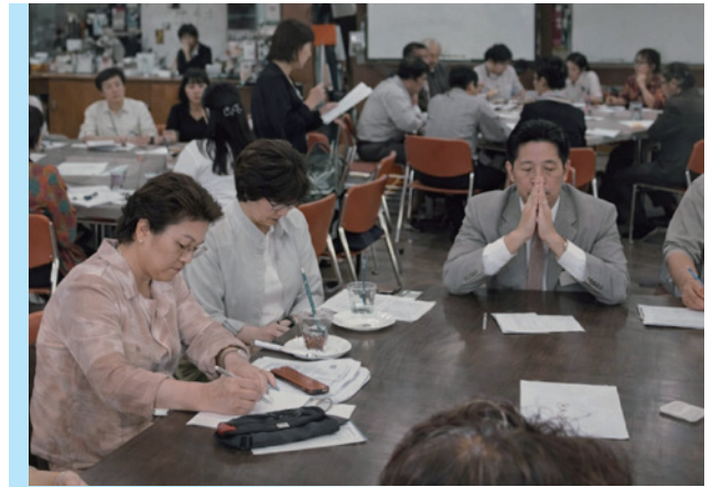
サポーターズミーティングの紹介記事(2003年)

読者との意見交換の場としては「サポーターズミーティング」を定期的に開催し、ごみの減量と資源リサイクルにどのように取り組むかを意見交換し、その様子を誌面で伝えてきました。また、環境と資源リサイクルに関する情報については、さまざまな視点と切り口で記事を制作し、多彩な誌面をお届けすることに努めました。例えば、リサイクル事業とは具体的に何をやる仕事なのかを伝えるため、創刊2号にしてアルミ缶のリサイクル現場、3号で横浜市の選別センターを紹介しています。このようなりサイクル現場のレポートのほかに、ごみと資源物の分別方法の解説、出し方のマナー講座、世界規模で議論される環境問題の解説、最新の環境用語の紹介なども定番のテーマとして掲載してきました。これらの話題は時代とともに変化と進化を続けており、最新の内容にアップデートしてもらうために同じテーマであっても繰り返し誌面にすることが重要と考え、読者の皆さまにリアルタイムの問題意識と知識の提供に努めてきました。