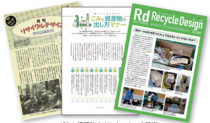
ごみと資源物の出し方マナーの記事