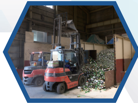
びんのリサイクル現場 (有限会社マルニ商店)