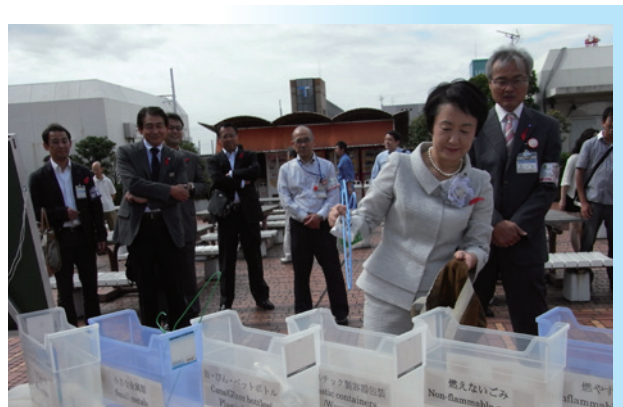
3R推進キャンペーンでごみの分別を行う林文字横浜市長(2011年)