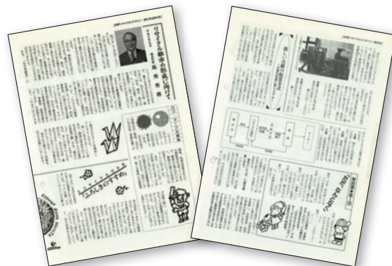
創刊5号に掲載された高秀秀信横浜市長の挨拶と6号の古紙分別収集の記事

横浜市の資源循環政策とともにリサイクル事業者の役割は変わり続けており、行政とともに歩んできたリサイクル組合の役割もまた、新しい時代を迎えています。