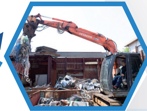
金属のリサイクル現場 (横浜アルコ株式会社)