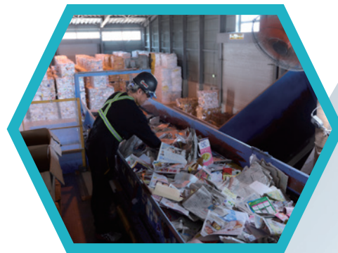
古紙の選別作業 (リサイクルポート山ノ内)